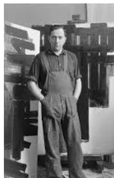
Pierre Soulages en 1954

On ne peut guère parler de Pierre Soulages sans évoquer l'outrenoir. Il ne semble pas que ses expériences dans l'obscurité des grottes de l'Aveyron soient à l'origine du thème qu'il a inventé où se rencontrent la peinture, les sciences et les technologies. Cependant l'art pariétal des cavernes ne le laisse pas indifférent. « Je me sens plus proche des lions de Chauvet que de la Joconde... Quand je vois leurs œuvres, je considère les peintres préhistoriques fraternellement. Entrer dans une grotte peinte est pour moi, comme pour tout le monde, quelque chose de bouleversant : on entre dans un ventre, dans le ventre de la Terre et je suis toujours profondément ému quand j'y découvre les productions de ces hommes d'il y a des centaines de siècles... »