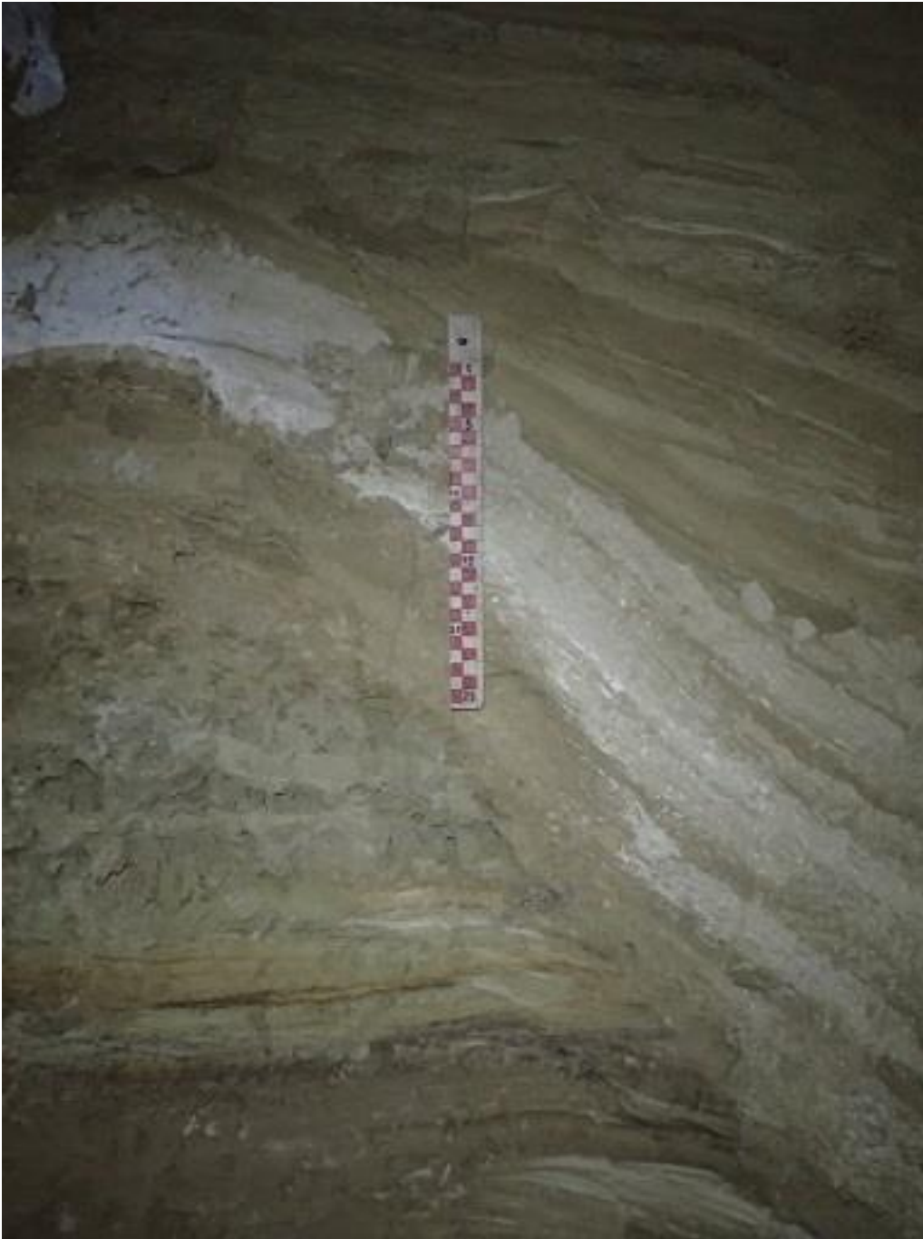
Encore le front de taille avant destruction