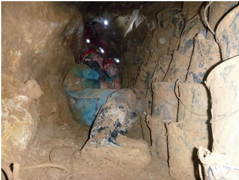
Un mur de 64 seaux à vider...