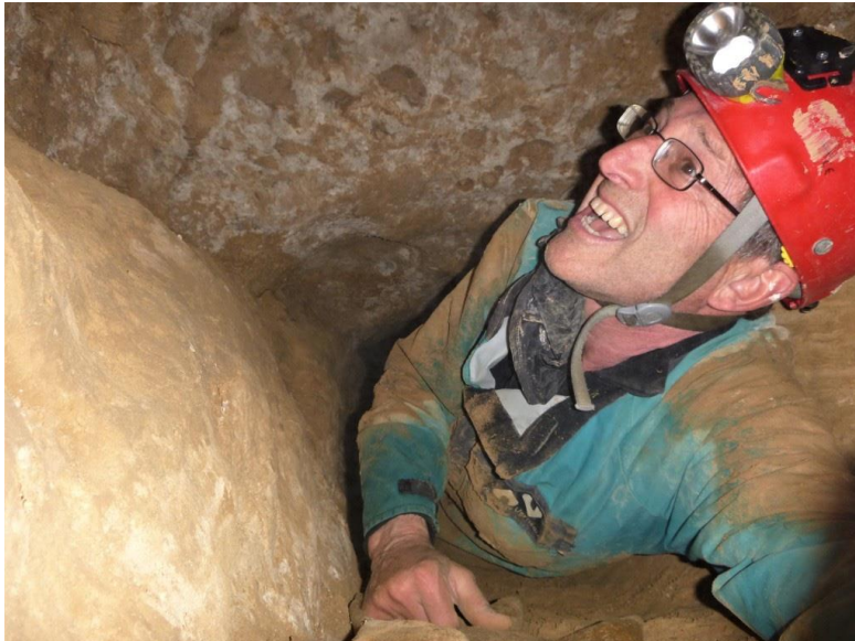
Senior ravi ...et un peu coincé en fond de galerie !