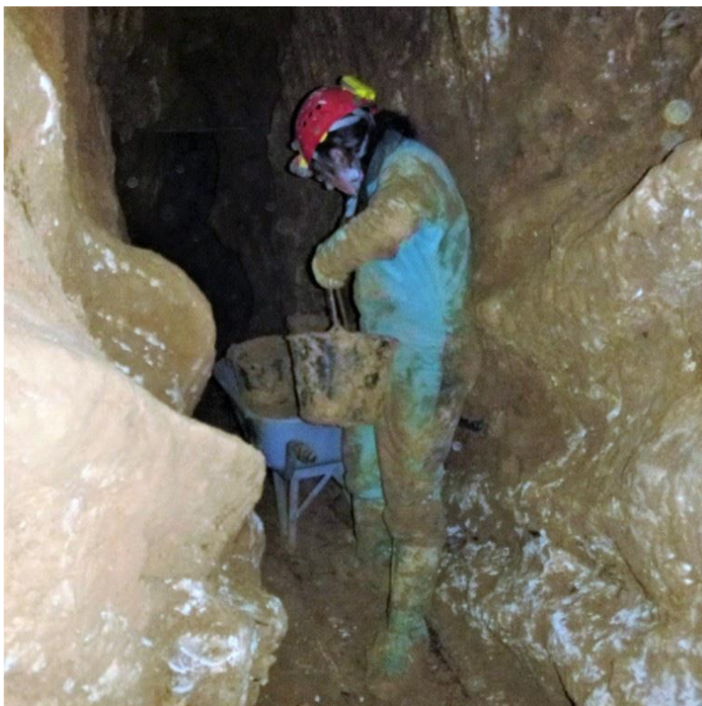
Néand au travail